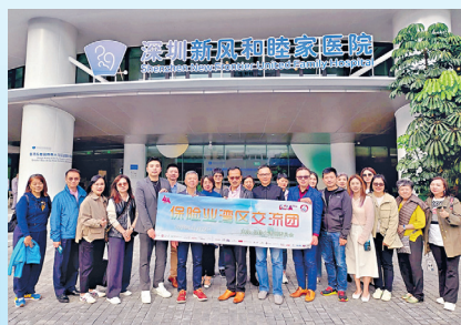
大會安排同行人士於11月22日參觀深圳醫療機構。