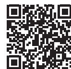
短訊發送人 登記冊