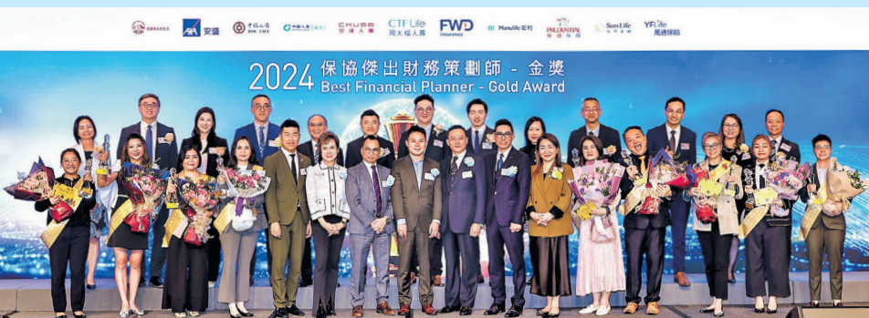
金獎得獎者與所屬公司代表大合照。