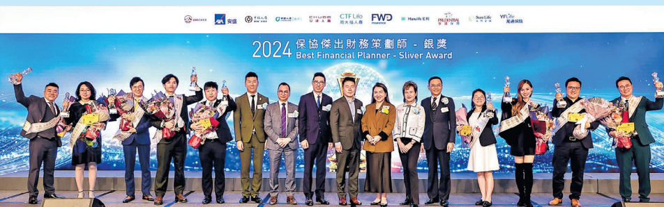
銀獎得獎者與大會代表合照。