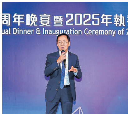
▲ 晚宴邀得立法會議員（保險界）陳健波為活動致辭

晚宴現場氣氛熱鬧，除了為來賓準備豐富美饌，更特別安排了精彩的表演及抽獎環節。在歡樂的氣氛中，與會嘉賓一邊品嚐美食，一邊回顧「保協」過去一年的豐碩成果，度過了一個難忘的晚上。