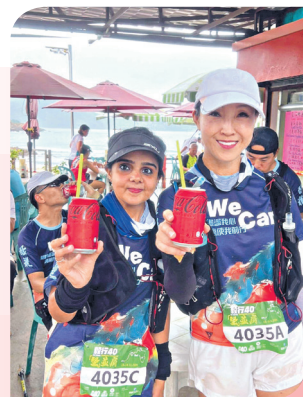
賽事路段縱然崎嶇且滿布泥濘，但亦為團隊成員帶來難忘的快樂回憶。