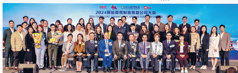
「2024保協傑出財務策劃公司大獎」及「2024保協優秀財務策劃公司大獎」同時由富衛人壽保險（百慕達）有限公司奪得。