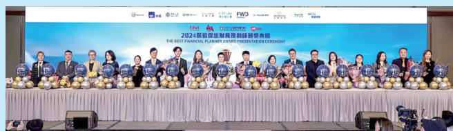
今屆BPFA大賽以嶄新揭曉方式，公布金銀獎，以及金中金得主。